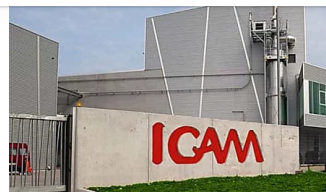
ICAM: il cioccolato sostenibile nel rispetto della filiera e del pianeta