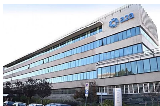
Agricoltura di precisione. Innovazione e opportunità per il "sistema-Italia"