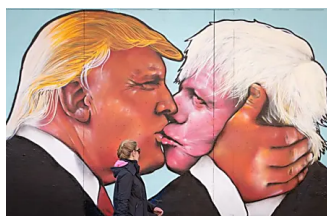
Boris Johnson è un euroscettico, non un populista