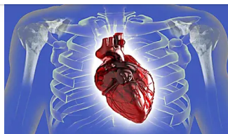
Caffè e tumore la verità sui rischi. Caffè e danni al cuore? La risposta