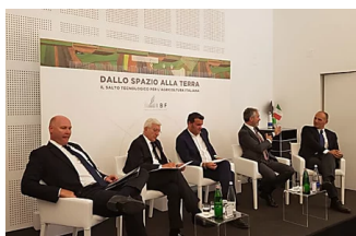
Al via hub tecnologico per un'agricoltura 4.0